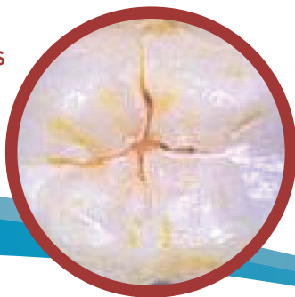
Picaduras y Fisuras

Sin Sellado Sin Protección de los Gérmenes que Causan la Caries