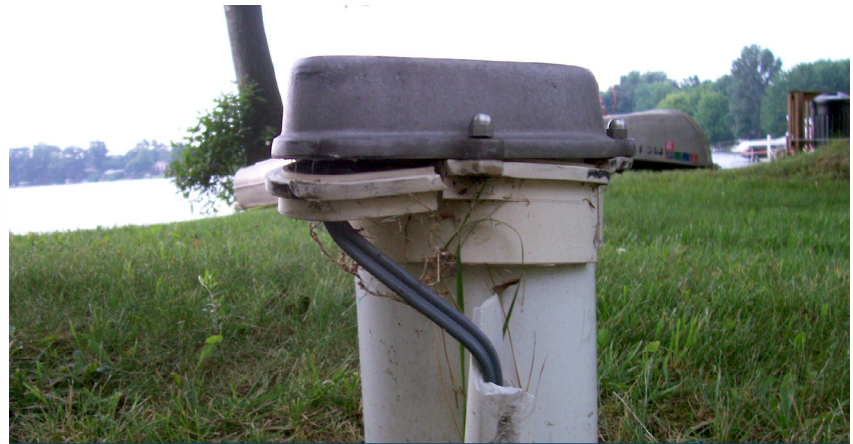
Una cabeza de pozo dañada con tapa de pozo agrietada y cables expuestos