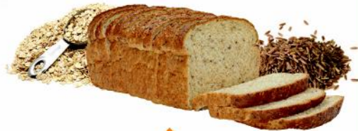
نغرفشالو بينلا زرلاو كعمكلو قئمكللا بويحلا/لمكللا حمقلا زيح