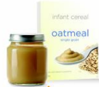
عسزلا قمعتلاً: موحللو تئورضخلاو هكولفلا عسزلا لائيوسلا بويح