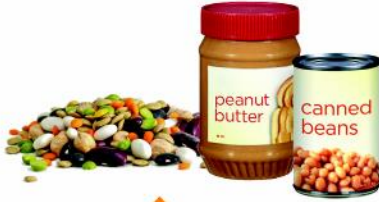
بندوسلا لوفلا كتيز لوفلا واً قئجلالو قئبعلا ليوصفالو