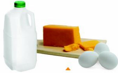
ضياوو قئجلالو يلحلا