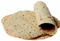
قمعتلا قئذلا رنطلف قئمكللا حمقلا قئجو