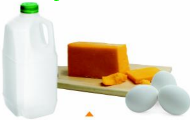
LECHE, QUESO Y HUEVOS