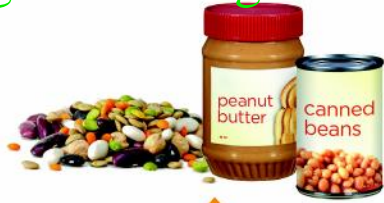
MANTEQUILLA DE CACAHUATE Y FRIJOLES O CHÍCHAROS SECOS Y ENLATADOS