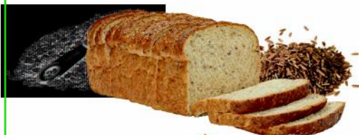
PAN Y BOLLOS DE TRIGO INTEGRAL O GRANO ENTERO, ARROZ INTEGRAL Y AVENA