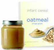
ALIMENTO PARA BEBÉS: FRUTAS, VERDURAS, CARNES Y CEREALES