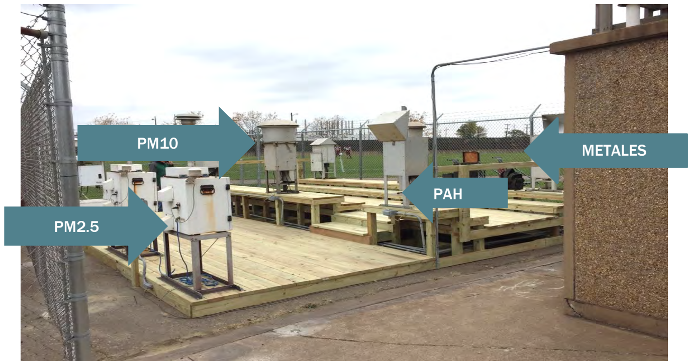
Figura 1: A continuación, se menciona la estación de monitoreo del aire de Dearborn en Salina Elementary School.

Desde principios de 1970, el Departamento de Medio Ambiente, Grandes Lagos y Energía de Michigan ha tomado medidas de contaminación del aire en exteriores o "ambiental" en todo el estado. El aire ambiental es el aire que respiramos donde vivimos, trabajamos o jugamos. Actualmente, EGLE monitorea el aire ambiental en busca de contaminantes como el ozono, el monóxido de carbono, el dióxido de azufre, los óxidos de nitrógeno, la materia en partículas finas (PM2.5 y PM10) y el plomo. También se miden otros contaminantes, como metales traza, compuestos orgánicos volátiles (VOC), hidrocarburos poliaromáticos (PAH), negro de carbón y carbonilos (como el formaldehído)