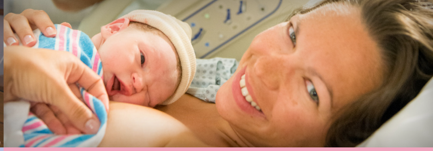
الوقوع في الحب