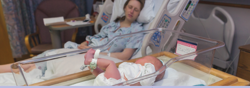
أبقي الطفل قريبًا منك