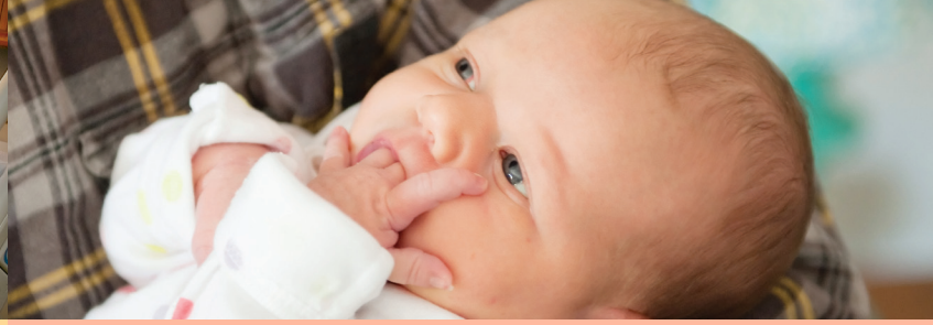
حاولي فهم طفلك

ستساعدك الممرضة في معرفة طريقة جيدة لإحكام فم الطفل لكي: