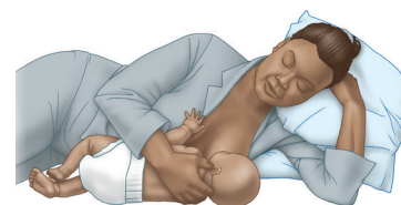
Acostada de lado