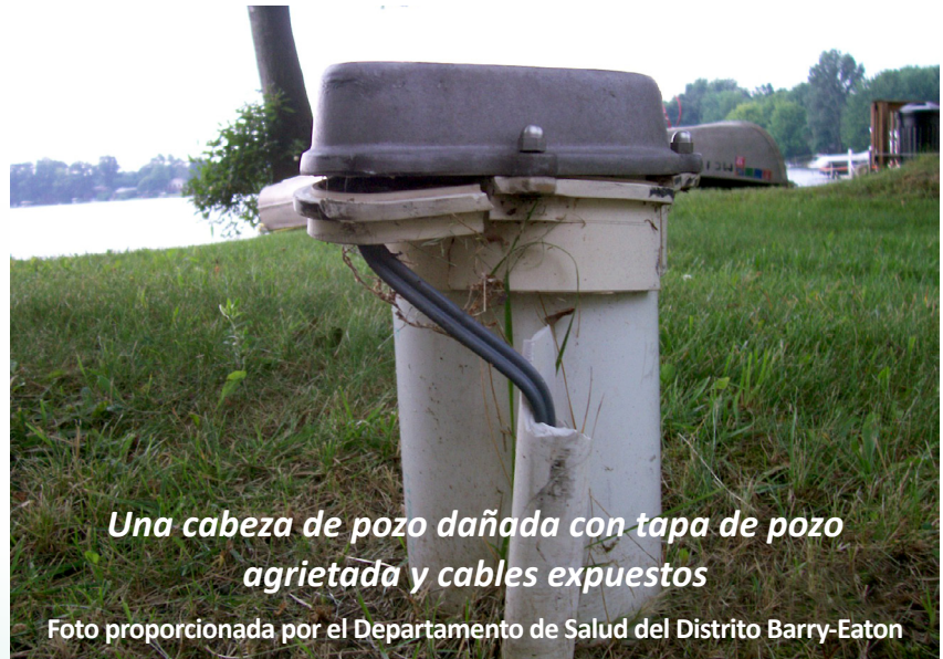
Una cabeza de pozo dañada con tapa de pozo agrietada y cables expuestos